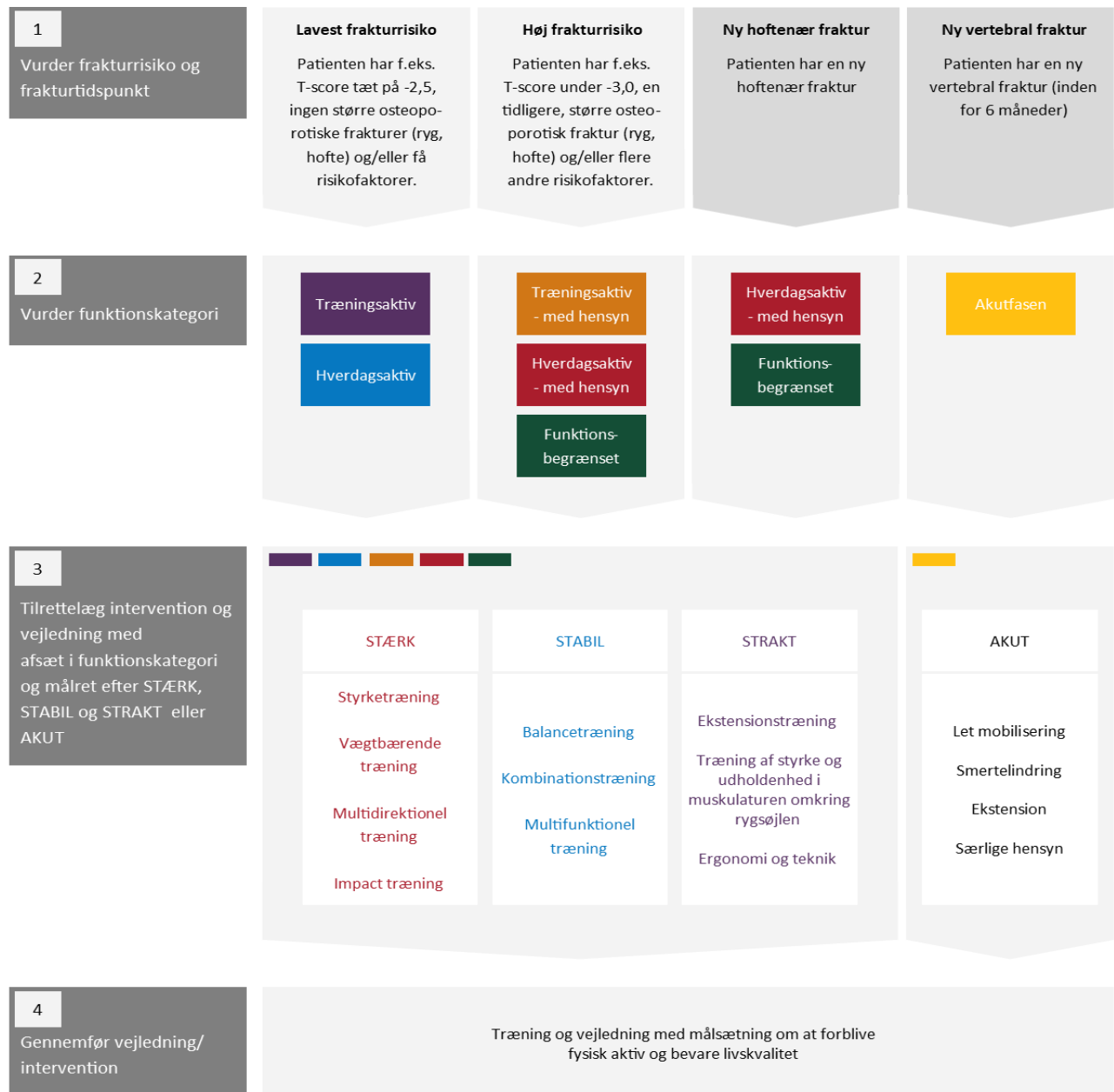
Fig. 6 Model for fysisk aktivitet og træning

For at imødekomme kompleksiteten omkring den nuværende viden om træning til patienter med osteoporose og operationalisere træningsanbefalingerne for denne brede patientgruppe, har Videnscenter for Knoglesundhed i samarbejde med Danske Fysioterapeuter , udviklet en model for fysisk aktivitet og træning [134].